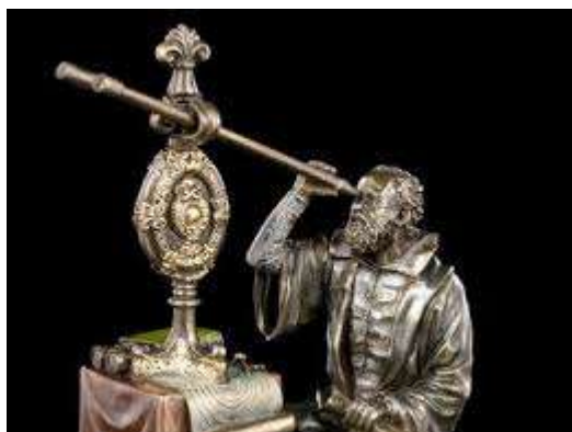
FIG.1- GALILEO OSSERVA IL CIELO CON IL CANNOCCHIALE